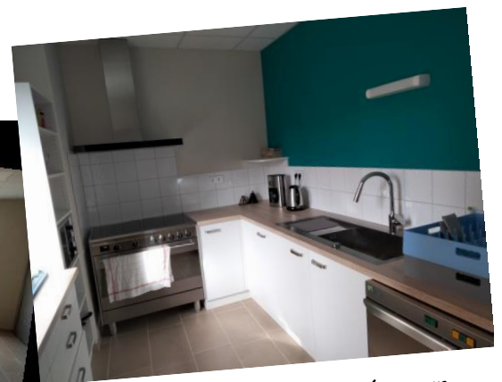
Une cuisine bien équipée pour vos réceptions familiales.