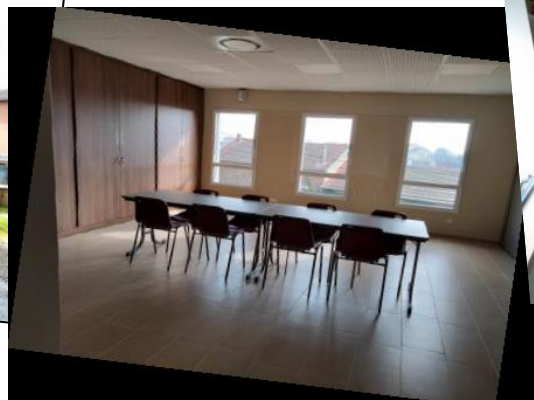
Salle de gauche